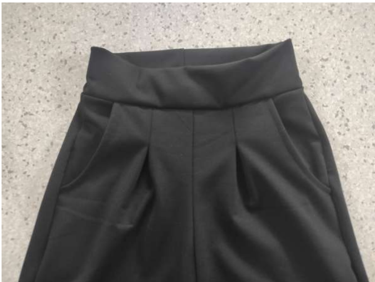
18. Pásek všitý.